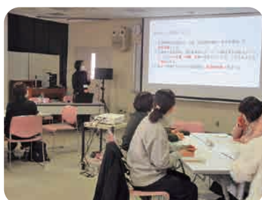
アンケート調査結果報告

地域包括システムにおいても医療と介護の連携は益々重要となり、看Ⅱ領域の看護職の役割発揮も求められています。そんな中、看Ⅱ領域の看護管理者が様々な課題を相談できず1人で抱え込むことがないよう、本委員会は情報交換ができる場づくり等を企画しその支援の在り方をこれからも検討していきます。