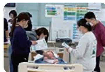
山口大学看護実践教育センター 演習で学ぶ 急変兆候の見方と 対応シミュレーション学習