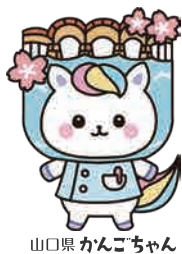
山口県 かんごちゃん