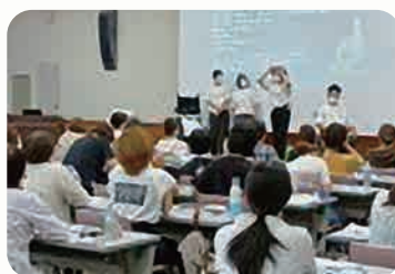
摂食嚥下ケアの基本 ～患者さんの食べたい気持ちに寄り添う～ 食事介助の実際、ポジショニングの場面