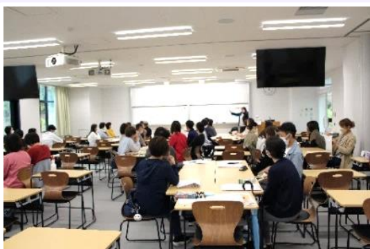
グループ演習では、アウトブレイク発生時の対応についてシミュレーションしました。(昨年度の様子)

通所サービスも含む高齢者保健福祉施設における感染対策の基本的知識や高齢者施設で多発する感染症に応じた対策の実際を学びます。また、新型コロナウイルス感染症を含む高齢者施設で多発する感染症を防止するための平常時の対策及び発生時の対応についてシミュレーション演習を行います。