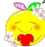
山口県看護協会 イメージキャラクター ヤマカンちゃんです。