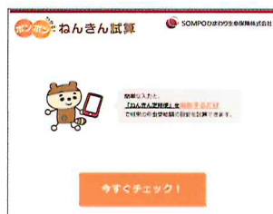
ねんきん試算 ホーム

「ねんきん定期便」をスマートフォンまたは タブレットのカメラで撮影し、必要項目を 入力するだけで、公的年金受給額の目安が 簡単に試算できます！