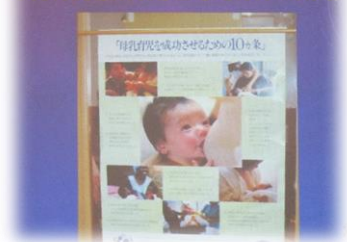
母乳育児を成功させるための10か条

令和2年11月28日(土)に開催し、新人助産師15名が参加しました。午前には、「母乳分泌のメカニズム」について乳房の解剖生理から母乳の栄養学について学びました。産褥期に起こりやすい乳房トラブルとケア方法についても詳しく講義して頂きました。また母乳哺育を支援する際の、母親に対する声掛けの重要性や乳房に関する知識を深めることができる内容でした。