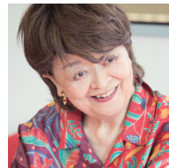
特別審査員 脚本家 内館牧子さん

詳しい募集要項、また過去の受賞作品は、 日本看護協会ホームページ ( https://www.nurse.or.jp/episode/ ) でご覧いただけます。